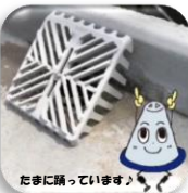
たまに踊っています♪

Instagramを2020年年末にスタートして一年半ほど経ちました！平日毎日画像を更新中しています。当初はインスタ映えるものではないから・・・と社内では皆、冷ややかな目でしたが(笑)、現在はフォロワー1700を突破しました。今後もコミュニケーションの場として更新して参りますので、ご高覧いただければ幸いです。コメント・メッセージお待ちしております！